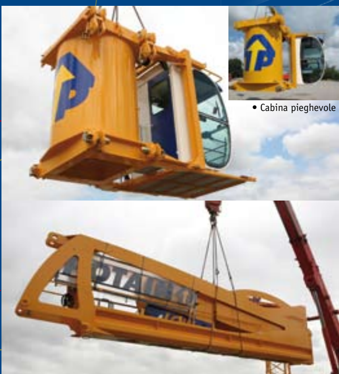
• Cabina pieghevole