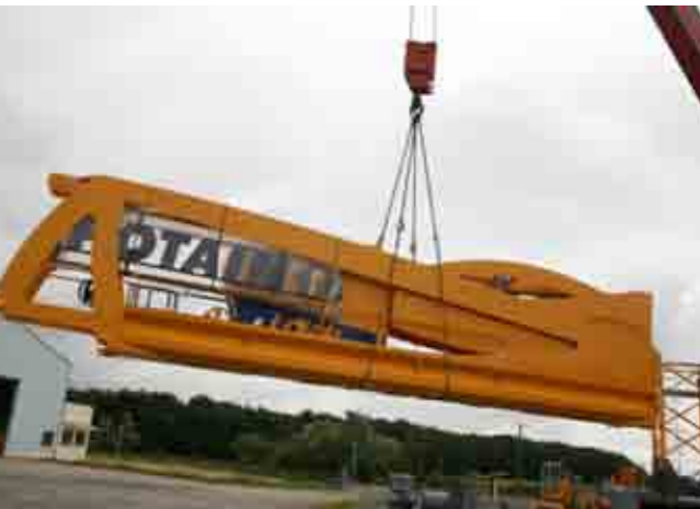
Controbraccio compatto con progettato per essere ripiegati durante il trasporto.

Nuovo profilo del braccio ottenuto attraverso una inclinazione regolare, offre un design dinamico e lineare.