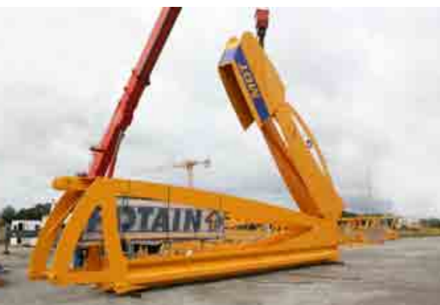
Spiegando la punta e la vela del controbraccio vengono liberate le traverse.

Forme, dimensioni e pesi dei componenti sono stati progettati per minimizzare gli ingombri e risparmiare tempo.