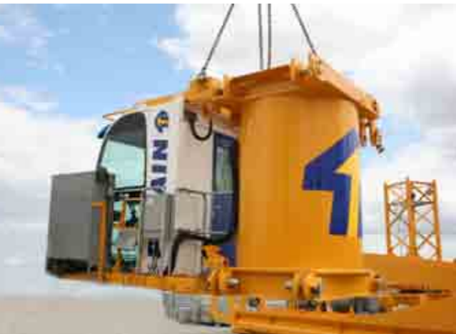
Cabina/torre in un'unica soluzione compatta.