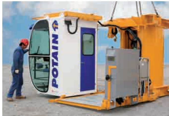
Cabina girevole. L'unità è pronta per il montaggio in pochi minuti: è sufficiente ruotare la cabina e bloccarla rapidamente in posizione.